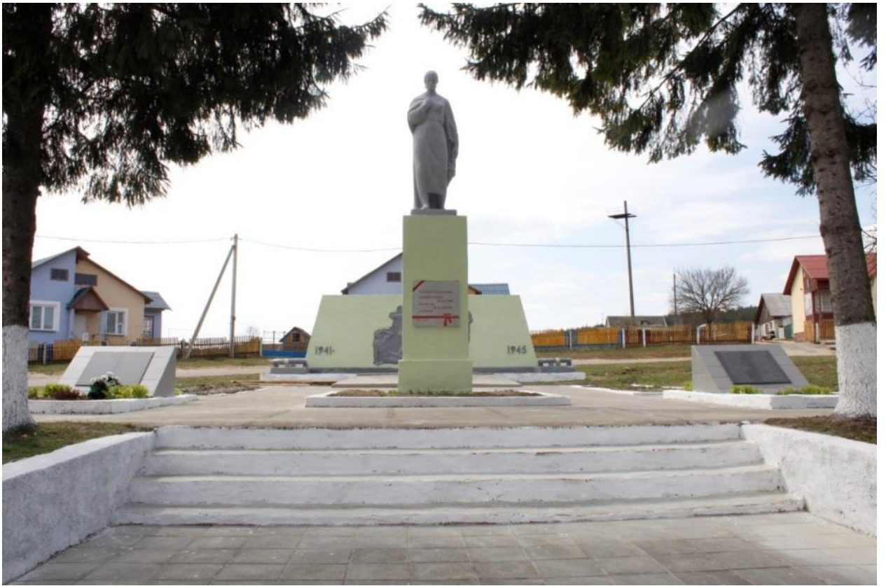
братская могила советских воинов, памятник погибшим землякам