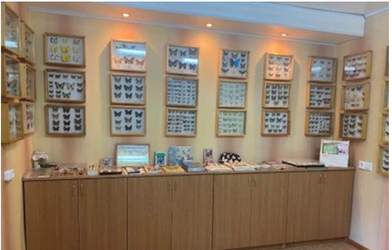
музей насекомых и пчеловодства