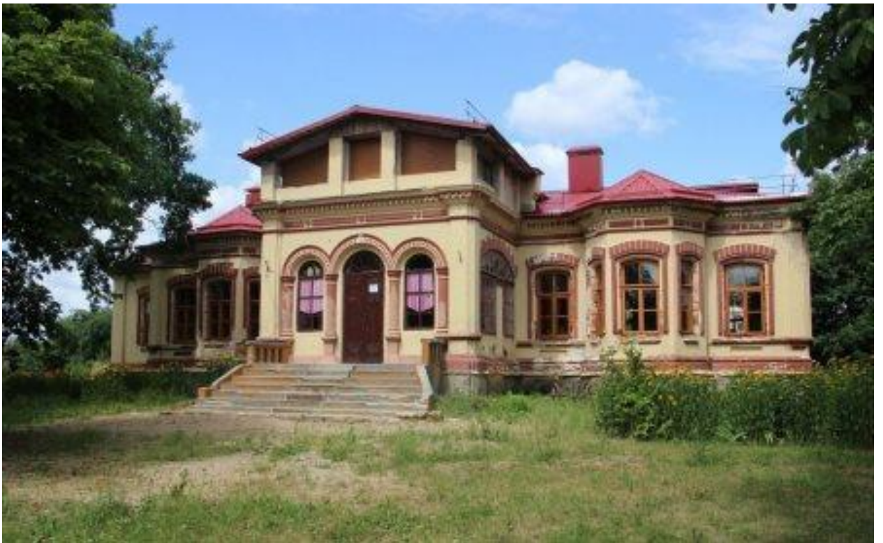
усадебный дом Жерно