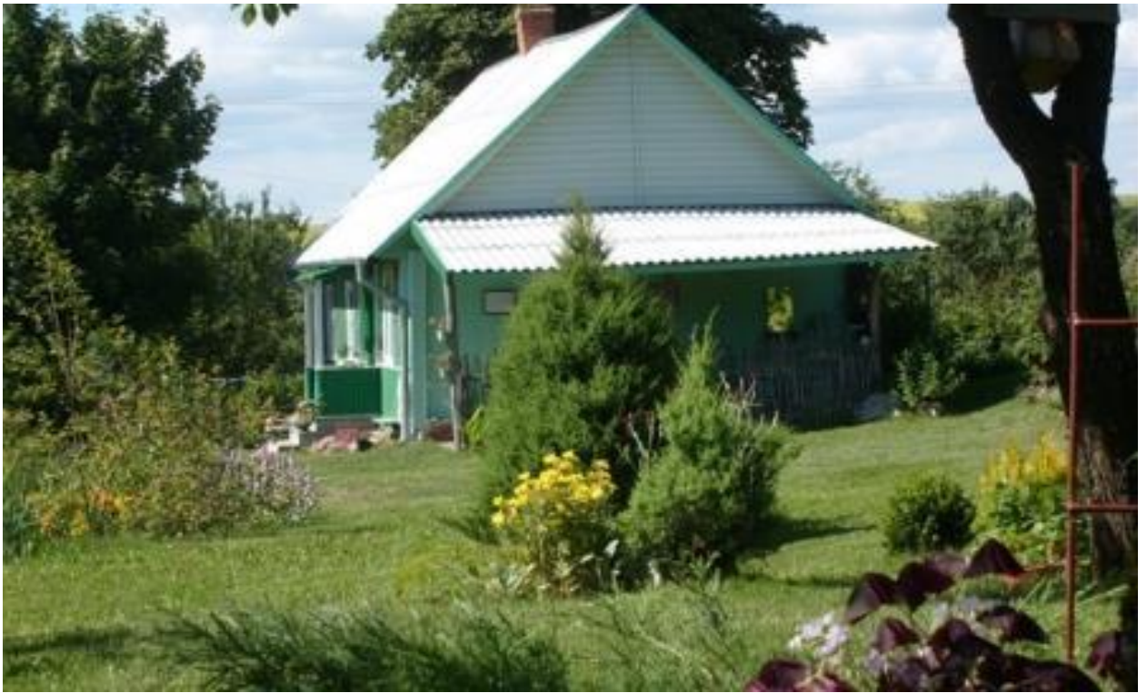
агроэкоусадьба «Старая Весь»