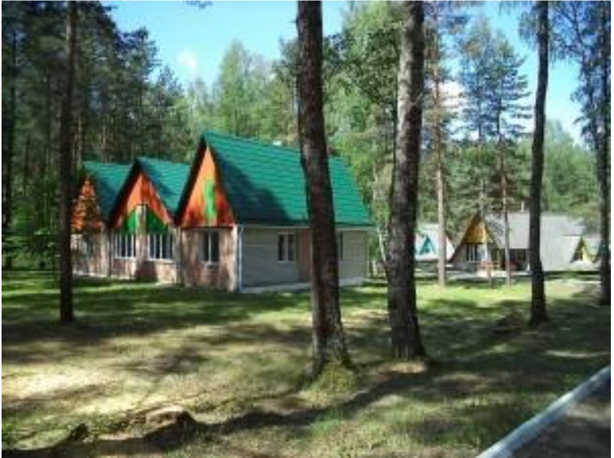
детский оздоровительный лагерь «Голубая волна»