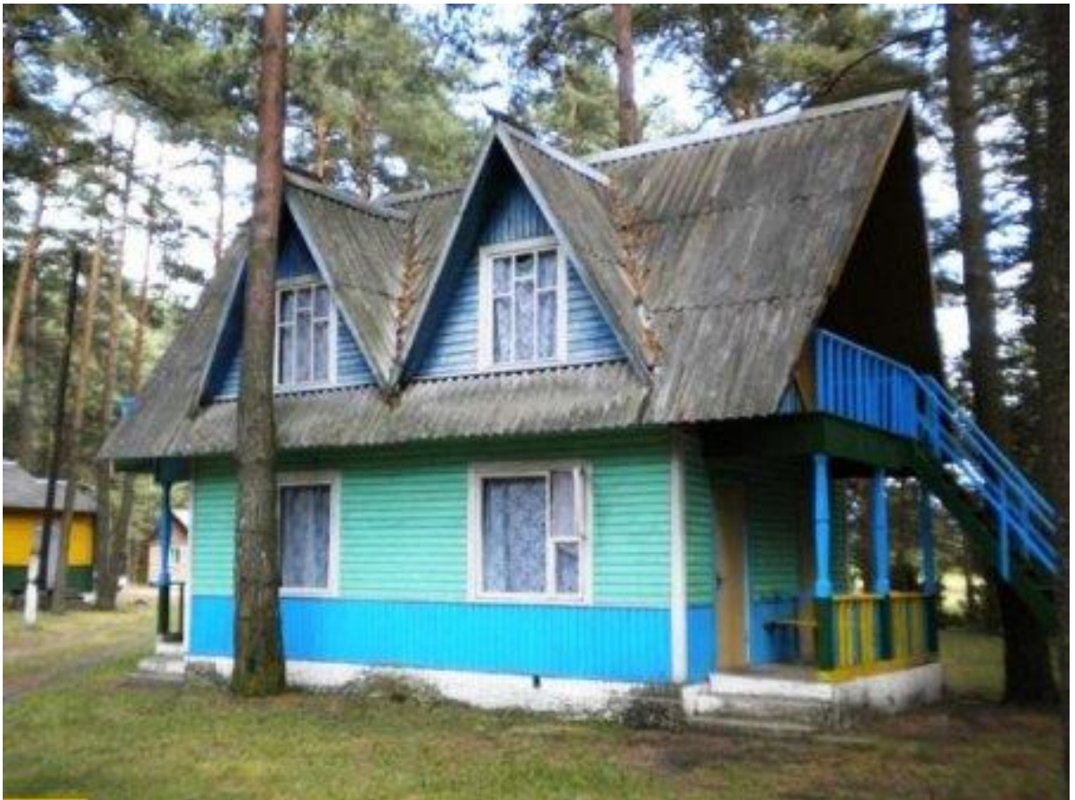
база отдыха «Бережки»