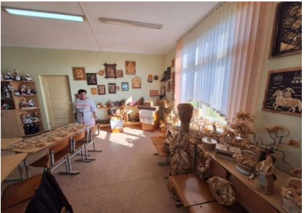
дом ремесел и традиционной культуры