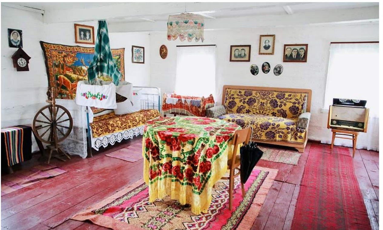
дом-музей сельского быта