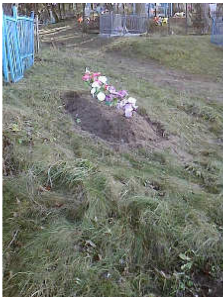
8. Фотоснимок воинского захоронения